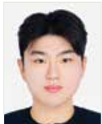
글로벌융합비즈니스학과 20학번 최 * 명