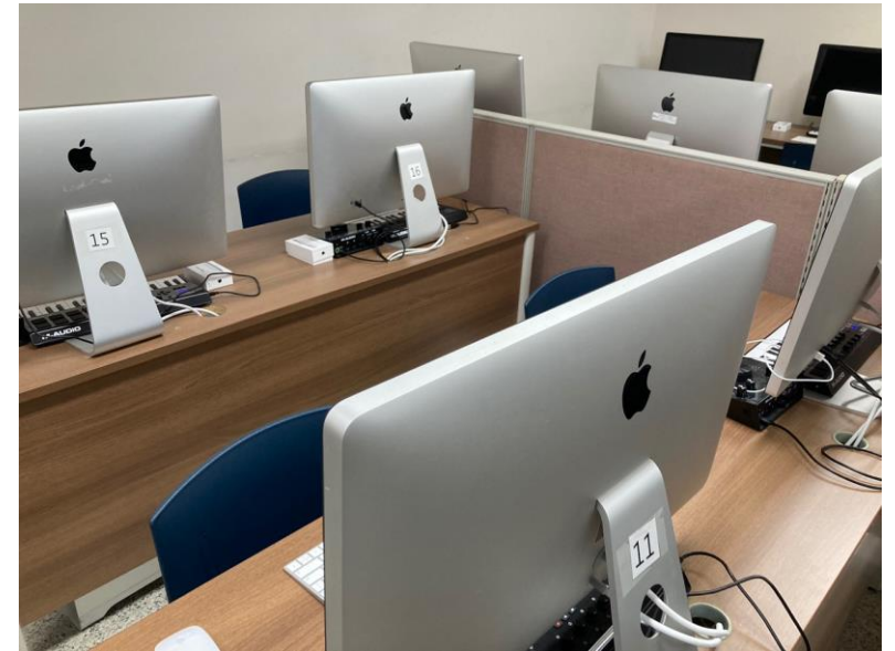
W17 105-1 실습실