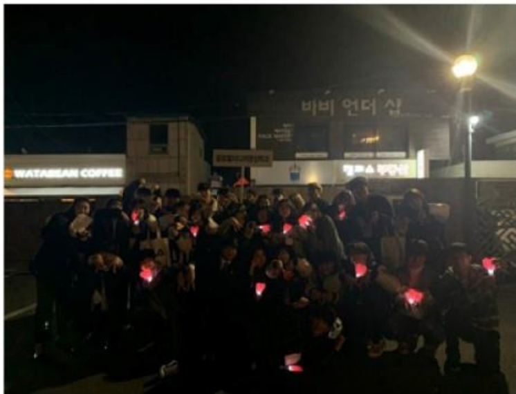
2019년도 새내기 콘테스트