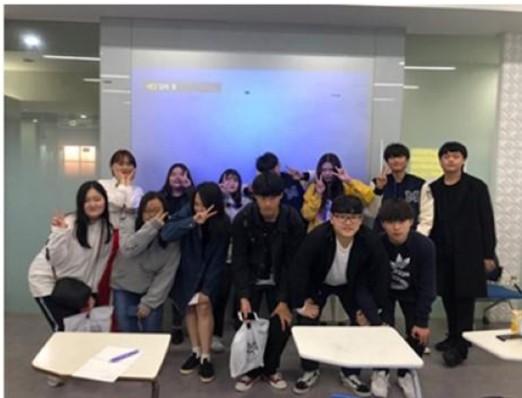
동아리 체험 교실