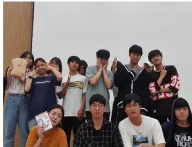
SIMA 영화 상영회