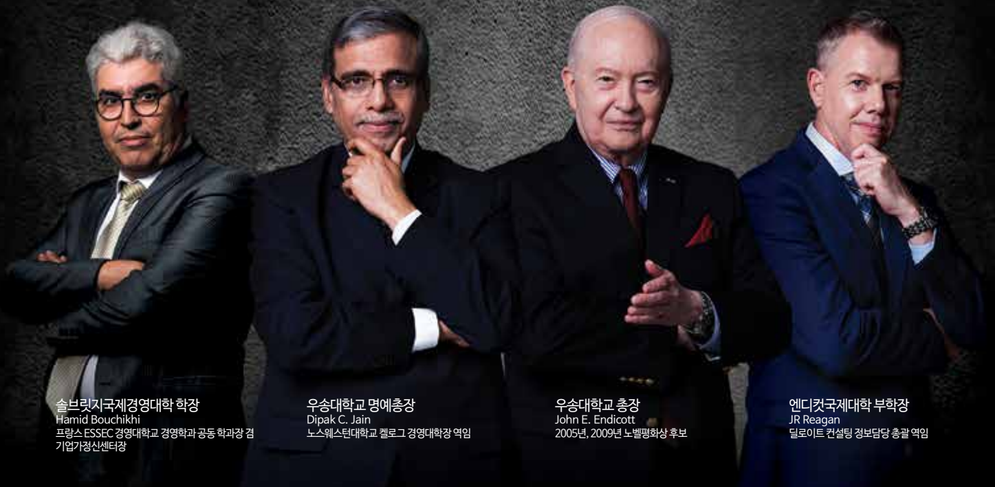
솔브릿지국제경영대학 학장 Hamid Bouchikhi 프랑스 ESSEC 경영대학교 경영학과 공동 학과장 겸 기업가정신센터장